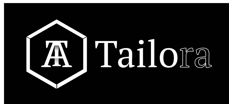
2. Version fond noir