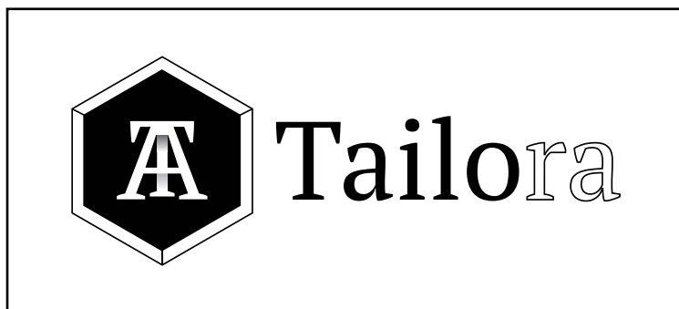
1. Version classique sur fond blanc

Deux version du logo sont possibles. L'une qui est la principale, en noir sur fond blanc et l'autre en blanc sur fond noir. Il es possible d'utiliser le pictogramme seul également.